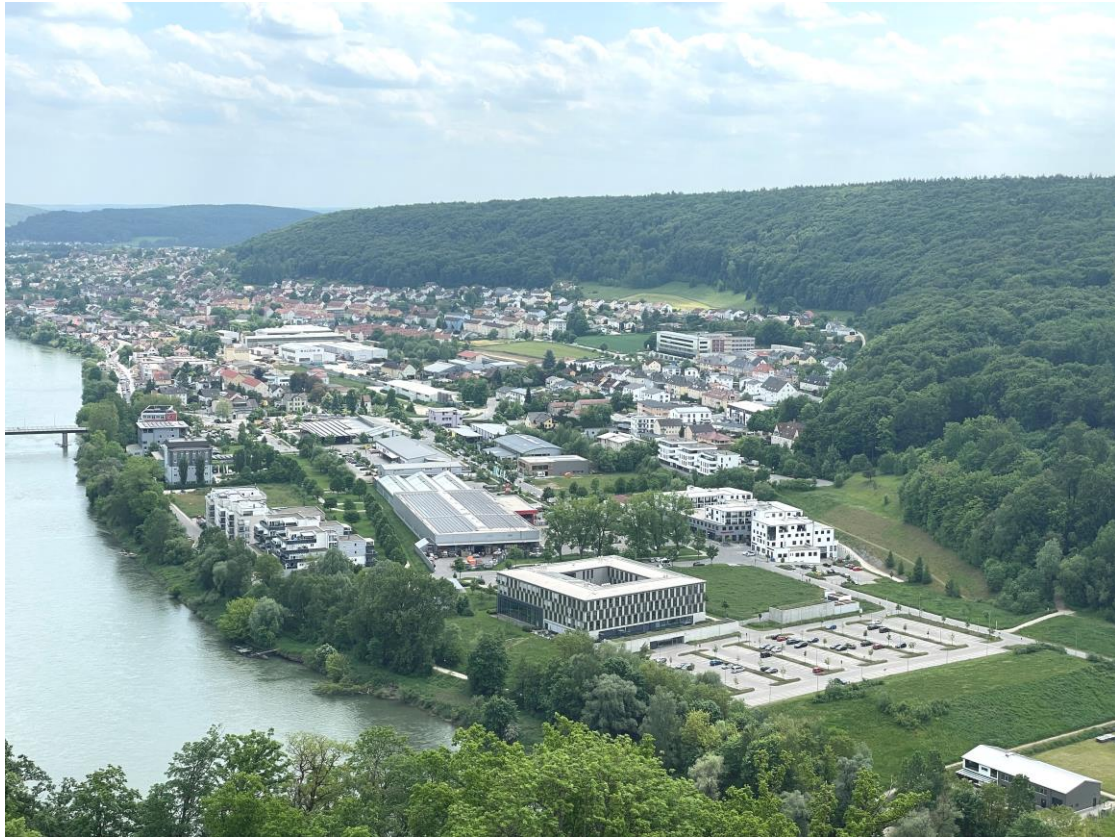
Der Donaupark im Mai 2023