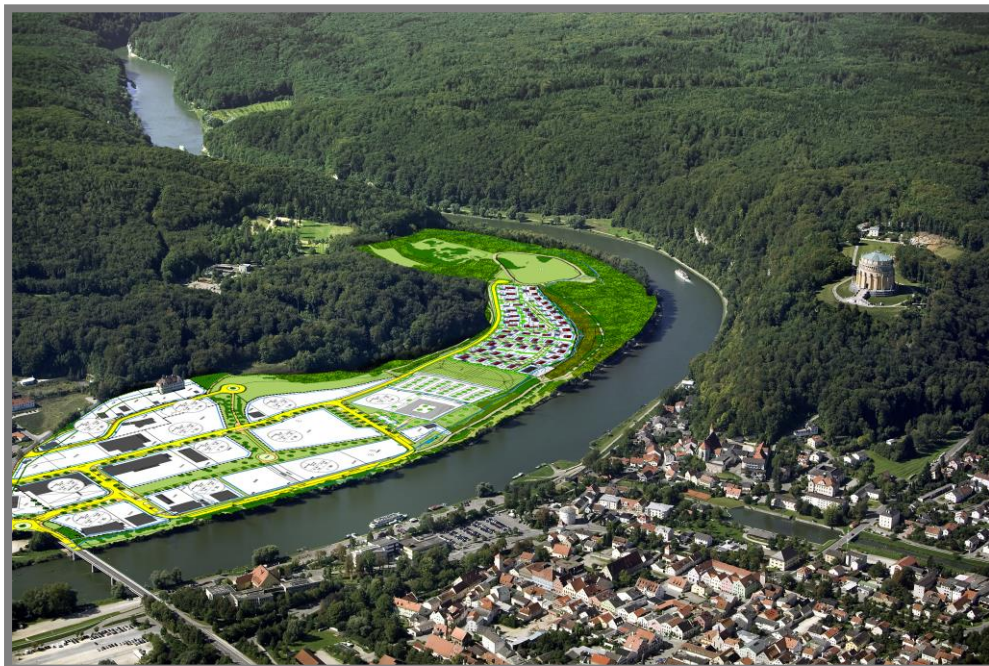
Rechtskräftiger Bebauungs- und Grünordnungsplan (07.11.2014)

Das Geschäftsjahr 2023 schloss mit einem Jahresüberschuss in Höhe von 51.020,40 € ab.