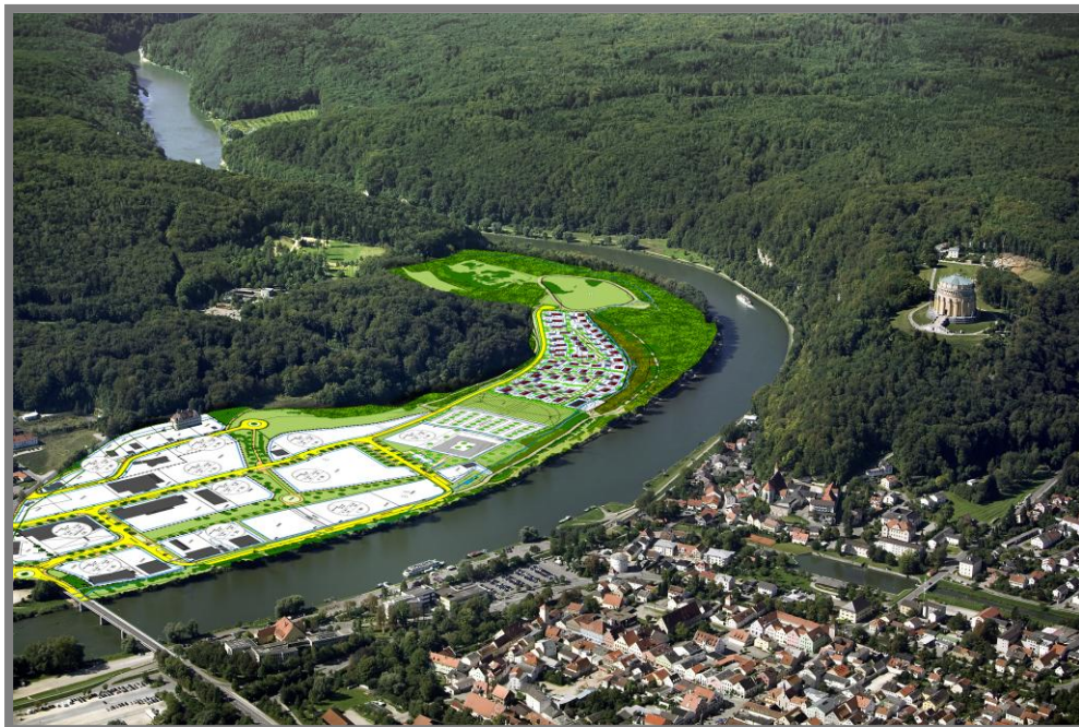
Rechtskräftiger Bebauungs- und Grünordnungsplan (07.11.2014)

Das Geschäftsjahr 2024 schloss mit einem Jahresüberschuss in Höhe von 160.497,49 € ab.